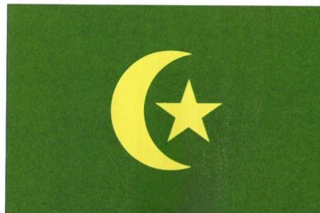
1709–1876-yillarda davlat ramzi bo'lgan Qo'qon xonligi bayrog'i