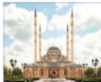
Grozniydagi "Checheniston yuragi" masjidi.