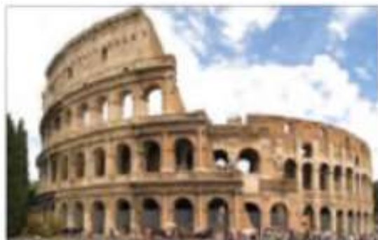
32-rasm. Rimdagi Kolizey.

VI. Uygʻa vazifani eʼlon qilish: yangi mavzuni toʻliq takrorlash va yangi mavzu yuzasidan bilimlarini mustahkamlab kelish.