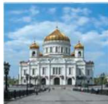
Moskvadagi Xristos Xaloskor cherkovi

Ruslardan tashqari unga ukrainlar, chuvashlar, mordvalar, osetinlar va boshqa bir necha millat vakillari e'tiqod qiladilar. Tatarlar, boshqirdlar, Shimoliy Kavkazdagi ko'plab xalqlar islom diniga mansub. Buryatlar, qalmiqlar hamda tualiklar esa buddizm diniga sig'inishadi. Rossiyada aholi zichligining o'rtacha ko'rsatkichi ancha past (1 km 2 ga 8 kishi), aholining hududiy joylashuvi esa juda notekis. Bunga, asosan iqlim sharoiti katta ta'sir ko'rsatgan. Aholi ko'proq