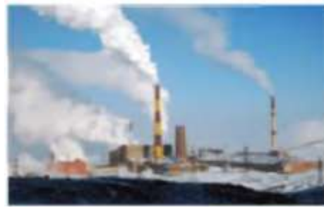
34-rasm. "Norilsk nikel" korxonasi.

Sanoati. Rossiyada sanoatning ko'plab tarmoqlari yaxshi rivojlangan bo'lib, iqtisodiyotining tayanchi yoqilg'i-energetika sanoati hisoblanadi. Rossiya neft zaxiralari bo'yicha jahonda 3-o'rin, ko'mir zaxiralari bo'yicha 2-o'rin, tabiiy gaz zaxiralari bo'yicha esa 1-o'rinda turadi. Bir necha yillardan buyon Rossiya neft va tabiiy gaz qazib olish hajmi bo'yicha jahondagi yetakchi 3 ta davlatlar qatoridan joy oladi. Yoqilg'ining umumiy eksporti bo'yicha esa Rossiya jahondagi yetakchi davlat hisoblanadi. Rossiya yoqilg'i sanoatining eng asosiy rayoni G'arbiy Sibir hisoblanadi. Elektr energiyasi ishlab chiqarish bo'yicha Rossiya jahonda Xitoy, AQSH va Hindistondan keyin to'rtinchi o'rinda turadi. Elektr energiyasining eng katta qismi issiqlik stansiyalarida ishlab chiqariladi (65 % dan ortiq), GESlar ulushi 16 % ga, AESlar hissasi esa 18 % ga teng. Qora metallurgiya ham Rossiya sanoatining tayanch tarmoqlaridan biri. Rossiya jahonda temir rudasini qazib olish bo'yicha 4-o'rin, po'lat eritish bo'yicha 5-o'rin, po'lat eksporti bo'yicha 4-o'rinda turadi (2019-y.).