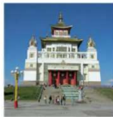
Elistadagi budda ibodatxonasi