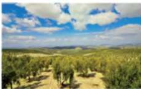
31-rasm. Italiyadagi zaytun plantatsiyalari.

Aholisi. Italiya Yevropadagi aholisi eng ko‘p beshta davlatlardan biri. 2018-yil ma’lumotlariga ko‘ra, Italiyada 60,6 mln. kishi istiqomat qiladi. Aholining tabiiy ko‘payishi manfiy bo‘lib, yillik hisobda -0,2 % ga teng. Lekin tashqi migratsiya hisobiga Italiya aholisi o‘sib bormoqda. Migrantlar orasida ruminlar, albanlar hamda Shimoliy Afrika davlatlaridan ko‘chib kelgan arablar son jihatidan yetakchi. Italiyada shahar aholisining ulushi 70 % atrofida. Mamlakatdagi eng yirik shahar aglomeratsiyalari Milan, Rim, Turin va Neapol shaharlari atrofida vujudga kelgan. Davlat tili - italyan tili. Aholining diniy tarkibida katoliklar yetakchilik qiladi. Italiya katoliklar soni bo‘yicha Yevropada birinchi o‘rinda turadi.