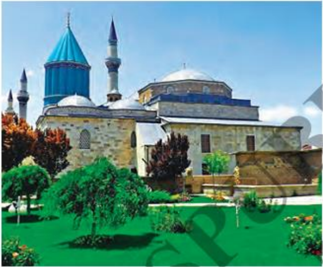
Jaloliddin Rumiy maqbarasi. Turkiya

Adabiyot va tarixnavislik Chigʻatoy ulusi davrida Turonda ilm-fan qoʻshni hududlarga nisbatan biroz oqsadi. Shunga qaramay, adabiyot, tafsir, tarixnavislik va hadis ilmi maʼlum darajada rivoj topdi. XIII asr va XIV asrning ikkinchi yarmida adabiyot yoʻnalishida, ayniqsa, Jaloliddin Rumiy (1207–1272), Saʼdiy Sheroziy (1219–1293), Amir Xusrav Dehlaviylarning (1253–1325) oʻrni va mavqeyi koʻtarilib, ular jahon adabiyoti olamida keng tanildilar. Asli Balx shahridan boʻlgan Jaloliddin Rumiy arab, fors va turkiy tillarda ijod qilgan yirik mutafakkir edi. Jaloliddin Rumiy xorazmshoh Jaloliddin Manguberdi kabi Sulton Takishning nabirasi boʻlgan va bu ikki yirik shaxs yaqin qarindosh edi. Umrining katta qismi Rum (Turkiya) davlatida oʻtgan uchun ham oʻziga Rumiy nisbasini olgan. Rumiy Halab, Damashq va Bagʻdod madrasalarida oʻqidi, mudarrislik qildi hamda buyuk tasavvuf shoiri va faylasufi boʻlib tanildi. U sheʼriyatda tasavvufiy-falsafiy janrni rivojlantirib, 36 ming baytdan iborat “Masnaviyi maʼnaviy” dostonini yaratdi. Asar Qurʼoni karim va hadisi sharif maʼnolarini oʻziga singdirgan, unda inson hayoti bilan bogʻliq barcha masalalar badiiy usulda bayon etilgan.