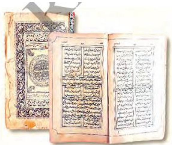
Jaloliddin Rumiy, “Masnaviyi maʼnaviy” asari