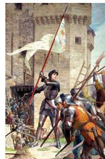
Janna d'Ark. Orléan shahri ozod qilinishi