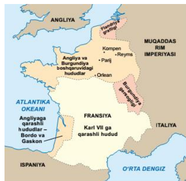
Yuz yillik urush davrida Fransiya xaritasi. 1435-yil

ko'ra olmas edi. Urush rasman 1337-yilda Angliyaning Fransiya hujumi bilan boshlandi. 1340-yilda inglizlar shiddatli harbiy harakatlarni amalga oshirib, fransuzlar flotini tor-mor keltirdi dengizda hukmron flotga aylandi. Shundan so'ng ikki tomon quruqlikda 1346-yil Kresi yaqinida to'qnashdilar. Urush fransuz ritsarlarining shijoati bilan boshlandi. Ritsarlar jangga o'zlarining jangovar qobiliyatlarini namoyish qilish imkoniyati sifatida qaradilar. Biroq urushning asosiy janglarida ritsarlar emas, dehqonlardan iborat piyoda askarlar jangovarlik ko'rsatdilar. Bu Yuz yillik urush tarixida muhim ahamiyatga ega bo'ldi. Kresi jangida fransuz qo'shinlari mag'lubiyatga uchradi. Eduard III boshchiligidagi ingliz qo'shini esa to'la g'alaba qozondi. 1358-yil Fransiyaning Bove viloyatida dehqonlar qo'zg'oloni boshlandi. Bu qo'zg'olon tarixga Jakeriya nomi bilan kirdi va qisqa vaqt ichida Sena, Marna, Il de Frans, Shampan viloyatlariga ham tarqaldi. Qo'zg'olonida 100 mingdan ortiq dehqonlar ishtirok etdi. Qo'zg'olonchilar qirol dehqonlarning azob-uqubatlaridan bexabar, u oddiy xalqqa xayrixoh deb ishonar edilar. Shuning uchun ham o'z bayroqlariga qirolning gerbi – oq nilufar tasvirini tushirishgan edi.