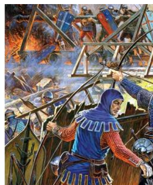
Yuz yillik urush. Puatye jangi