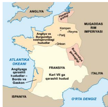
Yuz yillik urush davrida Fransiya xaritasi, 1435-yil

ko'ra olmas edi. Urush rasman 1337-yilda Angliyaning Fransiya hujumi bilan boshlandi. 1340-yilda inglizlar shiddatli harbiy harakatlarni amalga oshirib, fransuzlar flotini tor-mor keltirdi dengizda hukmron flotga aylandi. Shundan so'ng ikki tomon quruqlikda 1346-yil Kresi yaqinida to'qnashdilar. Urush fransuz ritsarlarining shijoati bilan boshlandi. Ritsarlar jangga o'zlarining jangovar qobiliyatlarini namoyish qilish imkoniyati sifatida qaradilar. Biroq urushning asosiy janglarida ritsarlar emas, dehqonlardan iborat piyoda askarlar jasorat ko'rsatdilar. Bu Yuz yillik urush tarixida muhim ahamiyatga ega bo'ldi. Kresi jangida fransuz qo'shinlari mag'lubiyatga uchradi. Eduard III boshchiligidagi ingliz qo'shini esa to'la g'alaba qozondi. 1358-yil Fransiyaning Bove viloyatida dehqonlar qo'zg'oloni boshlandi. Bu qo'zg'olon tarixga Jakeriya nomi bilan kirdi va qisqa vaqt ichida Sena, Marna, Il de Frans, Shampain viloyatlariga ham tarqaldi. Qo'zg'olonida 100 mingdan ortiq dehqonlar ishtirok etdi. Qo'zg'olonchilar qirol dehqonlarning azob-uqubatlaridan bexabar, u oddiy xalqqa xayrixoh deb ishonar edilar. Shuning uchun ham o'z bayroqlariga qirolning gerbi – oq nilufar tasvirini tushirishgan edi.