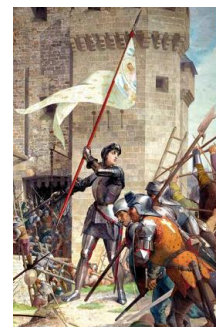
Janna d'Ark. Orleanning ozod qilinishi

kirdilar. 1420-yilda Fransiya uchun haqoratomuz Trua shartnomasi imzolandi. Janna d'Ark Orleana yetib kelib inglizlarga qarshi shiddatli janglarni boshlab yubordi. Uning o'zi janglarda mardlik va shaxsiy namuna ko'rsatar, asarlarni ruhlantirar edi. 1429-yilda Orlean shahri qamaldan ozod qilindi va bu Yuz yillik urushda tub burilish yasadi. Xalq Janna d'Arkka "Orlean qizi" deb nom berdi. Janna Orlean shahridagi g'alabasi bilan Yuz yillik urush oqimini Fransiya foydasiga keskin o'zgartirishga muvaffaq bo'ldi. Uning ishtirokida Fransiyaning qator viloyatlari ozod qilindi. Janna d'Arkning taklifi bilan qirol Karl VII (1422–1461) Reims shahriga borib, tantanali ravishda taxtga o'tirdi. Ular Janna d'Arkdan qutulish yo'lini izlay boshlashdi, unga hayotini xavf ostiga qo'yadigan vazifalar topshira boshladilar. 1430-yilda jasur Orlean qizi Kompen qal'asi uchun bo'lgan janglarda burgundlarga asir tushib qoldi.