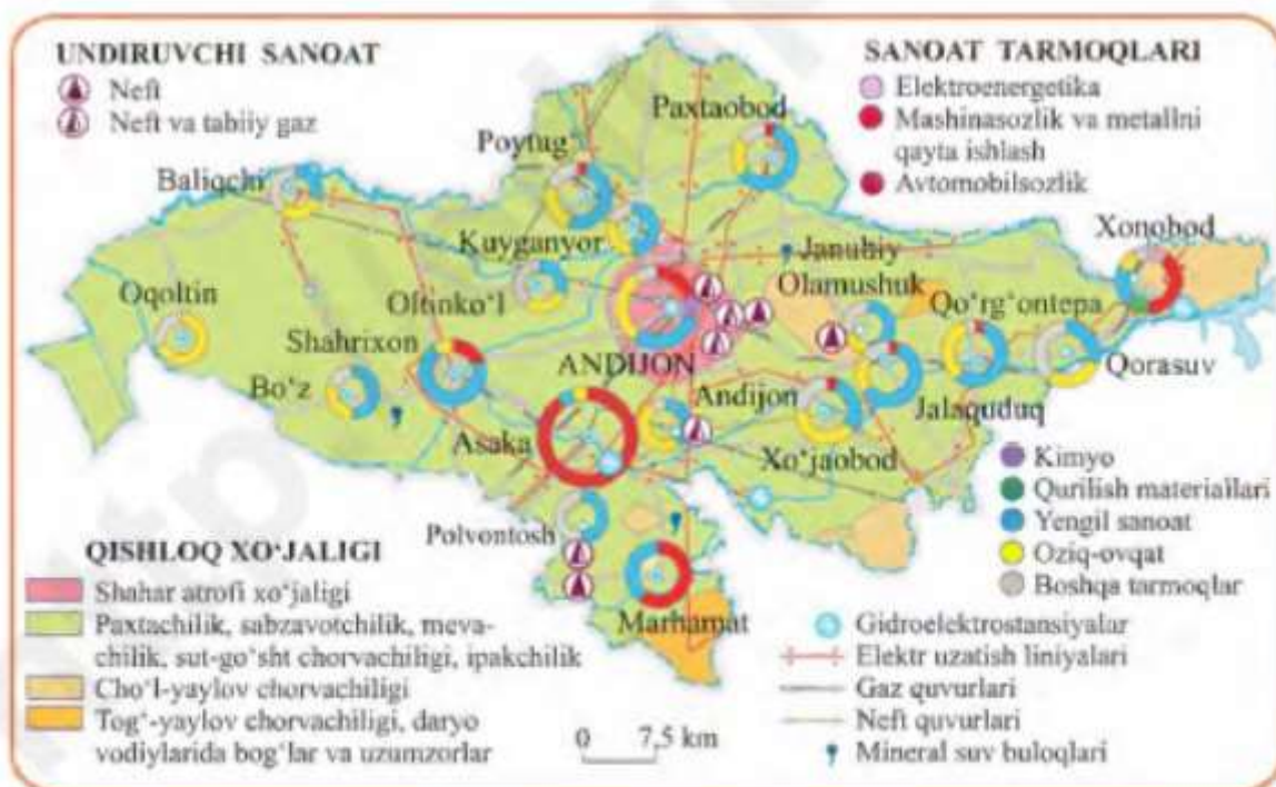
102-rasm. Andijon viloyati.