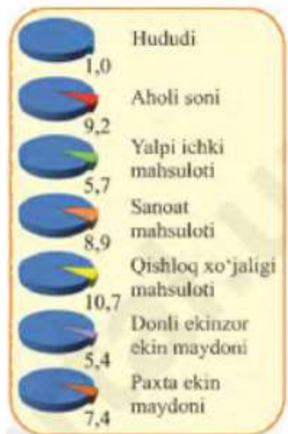
101-rasm. O'zbekiston Respublikasida Andijon viloyatining salmog'i (foiz, 2017-yil).

avtomashinalarni ham ishlab chiqarish yo'lga qo'yildi (103-rasm). Asaka shahri Shahrixonsoy daryosi oqib chiqadigan adirlik etagida joylashgan. Shaharni paxta dalalari, bog'lar, tokzorlar o'rab olgan. Shaharda avtomobil zavodidan tashqari, paxta-moy zavodlari, yengil va oziq-ovqat sanoatining boshqa korxonalari, shisha va kislorod zavodlari, binokorlik materiallari ishlab chiqaradigan korxonalar bor. Ko'pgina madaniyma'rifiy muassasalar ishlab turibdi. Shahar Andijon, Farg'ona va Marg'ilon yo'nalishidagi yo'llar ustida joylashgan.