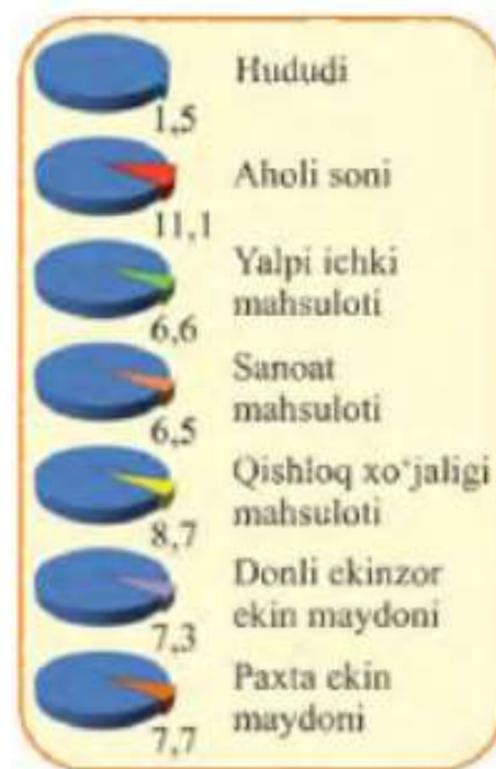
105-rasm. O‘zbekiston Respublikasida Farg‘ona viloyatining salmog‘i (foiz, 2017-yil).

VI. Uyga vazifani e‘lon qilish: Quvasoy sanoat markazi bilan Qo‘qon sanoat tugunini taqqoslab, eng muhim tafovutlarini tushuntiring.