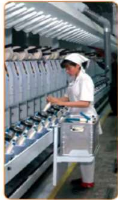
65-rasm. To'qimachilik korxonasi.

Un-yorma sanoati korxonalarida bug'doy qayta ishlanadi. Bug'doyni tashish un tashishdan birmuncha qulay. Ammo bug'doy yetishtiriladigan maydonlar iste'molchilar yashaydigan joy bilan deyarli yonma-yon joylashgani tufayli bug'doyni qayta ishlaydigan korxonalar (elevator)lar bug'doy yetishtirilayotgan joyda ham, yirik shaharlarda ham uchraydi. O'zbekiston o'simlik moyi ishlab chiqaruvchi yirik davlatlar sirasiga kiradi. O'simlik moyi bizda, asosan, paxta tozalash zavodlarida ajratib olingan chigitdan olinadi (67-rasm). Endi yog'-moy ishlab chiqaradigan korxonalarining geografik joylashuviga e'tibor qarataylik. Bu korxonalarining barchasi, avvalo, xomashyoga yaqin joyda, qolaversa, aholi zich hududlarda joylashganini ko'ramiz. Oziq-ovqat sanoatining yana bir muhim tarmog'i go'sht korxonalaridir .