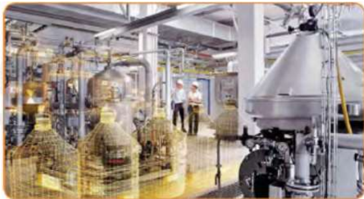
67-rasm. Yog'-moy kombinati moy ekstraksiya sexi.

Hozirda transportning tezligi va maxsus muzlatkichlar go'shtning sifatini buzmay uzoq masofaga tashish imkonini bermoqda. Shuning uchun go'sht mahsuloti ko'p iste'mol qilinadigan Toshkent, Andijon, Namangan, Farg'ona, Ohangaron kabi shaharlarda go'sht kombinatlari ishlamoqda. Non zavodlari, makaron, qandolat fabrikalari kabi korxonalar yirik aholi punktlarida joylashtiriladi (68-rasm). Yaqin vaqtlargacha Samarqanddagi choy qadoqlash fabrikasi nafaqat