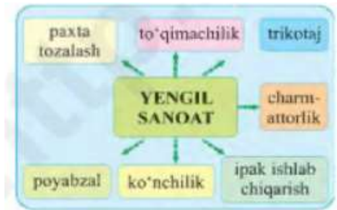
63-rasm. Yengil sanoat tarmoqlari.

zavodlari ko'proq mashinasozlik, yoqilg'i-energetika majmualari hamda to'qimachilik, yog', kiyim-kechak kabi sanoat korxonalari bilan ishlab chiqarish aloqasida bo'ladi. Birinchi paxta tozalash zavodi Toshkentda 1874-yilda qurilgan. O'sha davr zavodi bir mavsumda ko'pi bilan 3 ming tonna paxta tozalay olgan. Dastgohlarni esa suv kuchi harakatga keltirgan. Shu tufayli dastlabki vaqtlarda paxta tozalash korxonalari shaharlarda ham joylashgan. Zamonaviy paxta tozalash zavodi yil davomida 100 ming tonnagacha paxta tozalamoqda. XX asr boshidagi mayda, yarim hunarmandchilik (210 ta) korxonalar o'rnida endilikda mexanizatsiyalashgan 120 dan ortiq qudratli korxonalar ishlab turibdi (64-rasm).