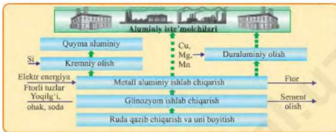
38-rasm. Aluminiy ishlab chiqarish.

Mis rudasi tarkibida molibden, oltin, kumush kabilar birga uchraydi. Bu yerda mis eritish zavodi va Olmaliq kon-metallurgiya kombinati ishlab turibdi. Kombinat Qalmoqqirkon, Qo'rg'oshin konlari, qo'rg'oshin-rux boyitish fabrikasi , elektr stansiyasi va bir qancha yordamchi korxonalardan iborat (38-rasm). Konchilarning obod shahri - Olmaliq kon o'zlashtirilishi jarayonida barpo bo'lgan.