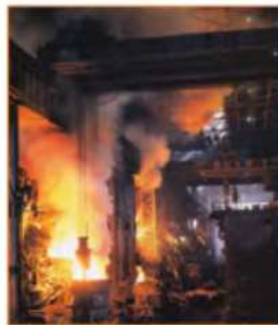
36-rasm. Metallurgiya zavodi.

Chunki kombinatlarda bir yo‘la temir rudasidan domna pechlarida cho‘yan eritib olinadi, suyuq cho‘yan va temir-tersakdan (metallomdan) po‘lat erituvchi (marten, konverter, elektr) pechlarda po‘lat eritiladi, po‘latdan esa tayyor mahsulot - prokat olinadi. Fan-texnika taraqqiyoti metall eritishning chiqindisiz texnologiyasini, metall olishning yangi, serunum usullarini joriy qilishga olib kelmoqdaki, bu po‘lat sifatini oshirishni va prokatning xilma-xil turlarini olishni ta‘minlamoqda. Metall olishning eng yangi usuli metallni domnasiz, ya‘ni rudani eritmay undan metallni ajratib olishdir. Qora metallurgiyada ishlab chiqarish uzluksiz markazlasha boradi. Bunda suv, elektr energiya, tabiiy gaz bilan ta‘minlash va tabiatni muhofaza qilish imkoniyatlari ham e‘tiborga olinadi.