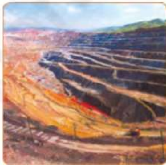
39-rasm. Muruntov oltin koni.

VI. Uyga vazifani e'lon qilish: O'quv atlasidan foydalanib, yozuvsiz xaritaga rangli metallurgiya markazlarini belgilang.