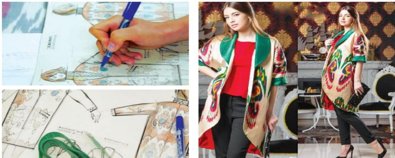
78-rasm. Libos dizayni

dizaynerlarining mahsulotlari dunyo bozoriga chiqdi va taniqli brendlarga aylandi. Tasviriy san'at bilan jiddiy shug'ullanib, dizayner bo'lish uchun dizayn turlari va yo'nalishlari borasida yetarli bilimga ega bo'lish talab etiladi.