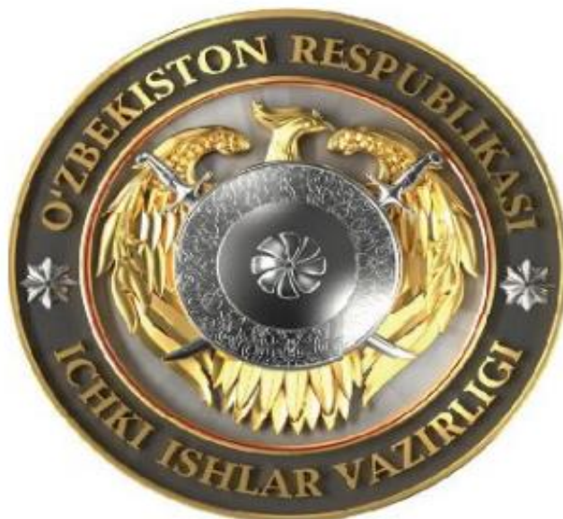
2-rasm. O'zbekiston Respublikasi Ichki ishlar vazirligi emblemasi