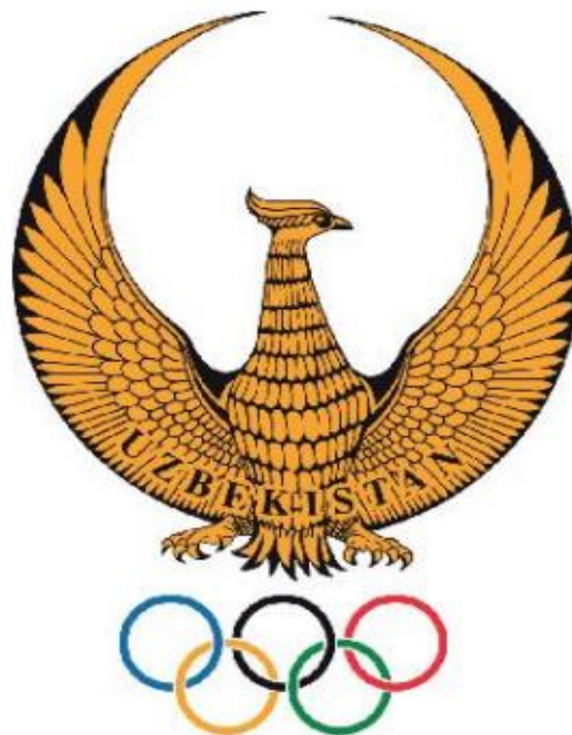
1-rasm. O'zbekiston Respublikasining Davlat gerbi hamda O'zbekiston Olimpiya qo'mitasining emblemasi