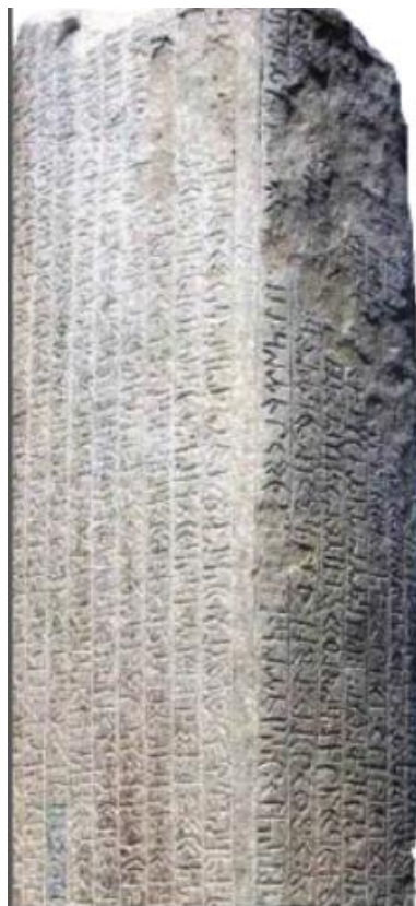
To'hyuquq bitiktoshi, VIII asr. Janubiy Mo'q'uliston

Mamlakatimiz tarixida ta'lim tizimining rivojlanishi uzoq tarixiy jarayon bo'lib, yozuvning paydo bo'lishi bilan bu jarayon yanada jadallashgan. Qadimgi tosh bitiklar, teri, sopol, yog'och (taxta) va keyinchalik qog'ozlarga tushirilgan ma'lumotlar ta'lim tarixidan so'zlovchi manba hisoblanadi.