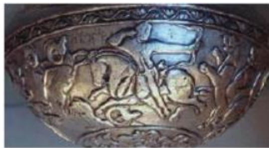
Ov manzarasi tasvirlangan mis idish. Eftaliylar davri, V asr. Pokistondan topilgan

Mamlakatimiz tarixida ta'lim tizimining rivojlanishi uzoq tarixiy jarayon bo'lib, yozuvning paydo bo'lishi bilan bu jarayon yanada jadallashgan. Qadimgi tosh bitiklar, teri, sopol, yog'och (taxta) va keyinchalik qog'ozlarga tushirilgan ma'lumotlar ta'lim tarixidan so'zlovchi manba hisoblanadi.