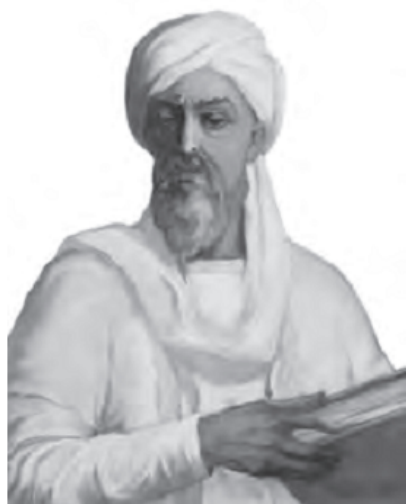
Abu Ali ibn Sino

Demak, musiqa insonga ma'naviy oziqa bo'lishi bilan birga uni tarbiyalashda ham ahamiyatli ekan. Chunki, ruhi tetik va barkamol kishi o'zida yaxshi insoniy fazilatlarni mujassam eta oladi.