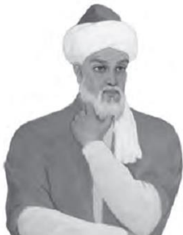
Abu Nasr Forobiy

Sharq allomalari, shayxulmashoyixlar musiqa san'atiga yuqori baho berib, uning inson ruhiga ma'naviy quvvat bo'lib xizmat qilishini alohida ta'kidlaganlar. Xususan, Hazrat Abu Bakr Buxoriy-Kalobodiy (vaf. 994-y.) musiqa tovushlari – nag'malarni ta'riflab, ularni “jon quvvati va ruh ozig'i turur. Agar jon nag'madan quvvat topsa, o'z maqomi sari ishrof aylaydi, ul maqom ila mashg'ul bo'lardi”, deb yozadi.