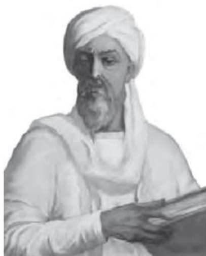
Abu Ali ibn Sino

Demak, musiqa insonga ma'naviy oziqa bo'lishi bilan birga uni tarbiyalashda ham ahamiyatli ekan. Chunki, ruhi tetik va barkamol kishi o'zida yaxshi insoniy fazilatlarni mujassam eta oladi.