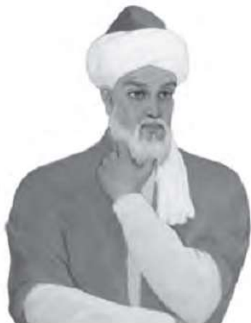
Abu Nasr Forobiy

Sharq allomalari, shayxulmashoyixlar musiqa san'atiga yuqori baho berib, uning inson ruhiga ma'naviy quvvat bo'lib xizmat qilishini alohida ta'kidlaganlar. Xususan, Hazrat Abu Bakr Buxoriy-Kalobodiy (vaf. 994-y.) musiqa tovushlari – nag'malarni ta'riflab, ularni “jon quvvati va ruh ozig'i turur. Agar jon nag'madan quvvat topsa, o'z maqomi sari ishrof aylaydi, ul maqom ila mashg'ul bo'lardi”, deb yozadi.