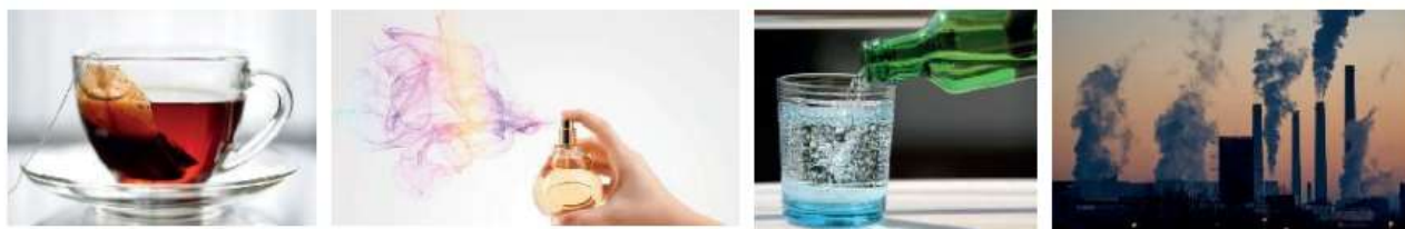
Kundalik hayotdagi diffuziya hodisasiga misollar

Botanik olim R. Braun 1827-yilda taso difan molekullarning cheksiz hara katini aniq ko'rsatuvchi juda muhim kashfi yot qildi. U o'simliklarning changlarini mikroskop ostida ko'rish maqsadida chang larga suv tomizib, aralastirib mikroskop ostiga qo'ydi. Okulyardan qarab, chang ning harakatlanayotganini va uning hara katini istalgan vaqtda kuzatish mum kinligini ko'rdi. Kichik zarra cha larning bu harakati keyinchalik "Braun harakati" deb ataldi. Olimlar mikroskop ostida ko'rilgan gul changlarining harakatini molekullarning ko'rinmas harakati bilan izohladilar. Ko'rinmas suv molekullari tartibsiz harakatlanib, yengil gul changlarini itaradi va ularni ham tasodifi y harakatga keltiradi. Molekullarning harakatini diff uziya hodisasi ham tasdiqlaydi (lotincha "diff usio" – tarqalish). Bu harakatla nuvchi bir moddaning molekullari boshqa bir moddaning molekullari orasiga kirib borishi bilan bog'liq. Masalan, hidning havoda tarqalishi, qandning suvda erishi va boshqa shunga o'xshash hodisalar diff uziyaga misol bo'ladi. Haroratning oshishi bilan diff uziya tezroq sodir bo'ladi, chunki bu holda molekullar tezroq harakatlana boshlaydi.