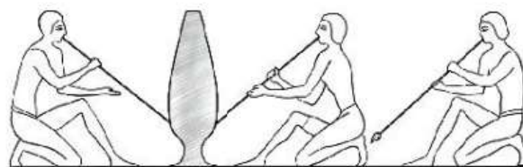
Misr shisha puflagichlari

Sharq allomalari va Ma'mun akademiyasining kimyo fani rivojidagi ilmiy ishlari hozirgi davrda ham dolzarb. Abu Yusuf ibn Is'hoq al-Kindiy (800–870-yy.) mashhur arab faylasuf, matematigi, astronomi va tabibi Basrada tug'ilib, Bag'dod shahrida vafot etgan. Al-Kindiy birinchi arab aristotelchilaridan bo'lib, Sharq aristotelizmi asoschisi hisoblanadi. Aristotel, Yevklid, Ptolomey kabi qadimgi yunon faylasuflarining asarlariga 40 dan ortiqroq risola va sharhlar yozgan. Alkimyoni tanqid qilgan olimlarning eng birinchisi ham al-Kindiy hisoblanadi. Uning asarlari o'rta asrlarda G'arbiy Yevropada tarjima qilingan va shuhrat qozongan. "Har xil turdagi qilichlar va nomdor temir pichoqlar haqida", "Farmakopeya haqida", "Tutatqi va distillash kimyosi haqida" nomli asarlarida kimyoga oid ma'lumotlar keltirilgan.