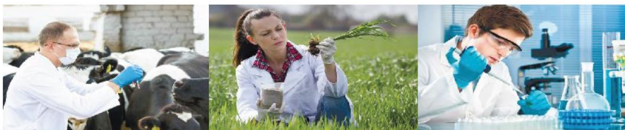
1.3-rasm. Biologiya bilan bog‘liq kasblar.