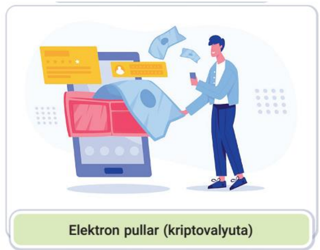
Elektron pullar (kriptoalyuta)