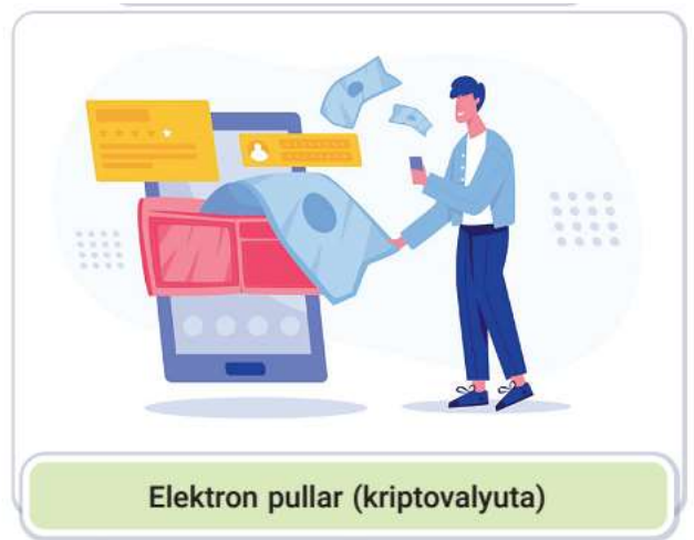
Elektron pullar (kriptoalyuta)