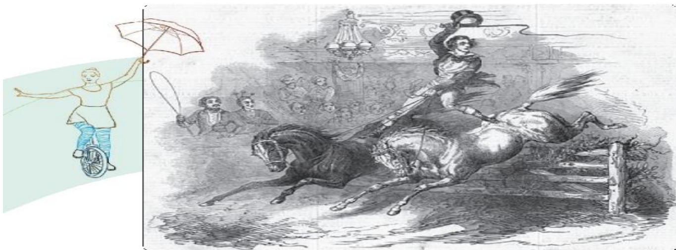
Filip Astleyning ilk sirk tomoshalari