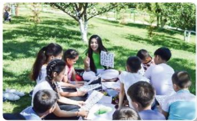
Yozgi oromgohdan lavhalar