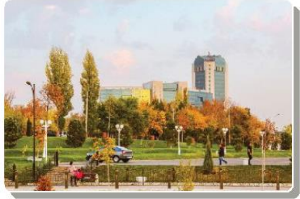
O'zbekiston tog' va shaharlarida kuz manzarasi (foto)