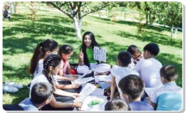
Yozgi oromgohdan lavhalar