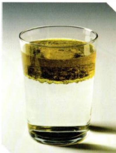
Suv va yog'ning aralashishi