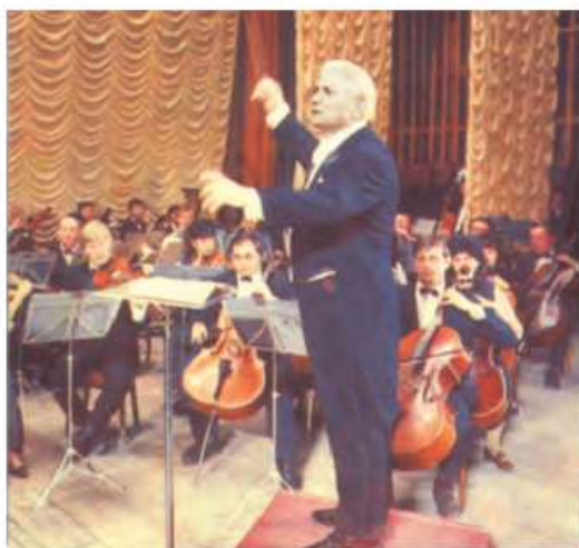
Mashhur kompozitor va dirijor Muxtor Ashrafiy

O‘zbek zamonaviy musiqasi deganda, hozirgi kunda ijro etilayotgan barcha musiqa turlarini tushunamiz. Ular janr nuqtayi nazaridan rang-barang bo‘lib, oddiy musiqiy namunalardan hamda murakkab asarlarni o‘z ichiga oladi. Demak, bular o‘zbek xalq folklor musiqasi, maqomlar, an’anaviy bastakorlik va zamonaviy kompozitorlik ijodiga mansub musiqiy namunalardir. Zamonaviy o‘zbek musiqasi orasida kom-