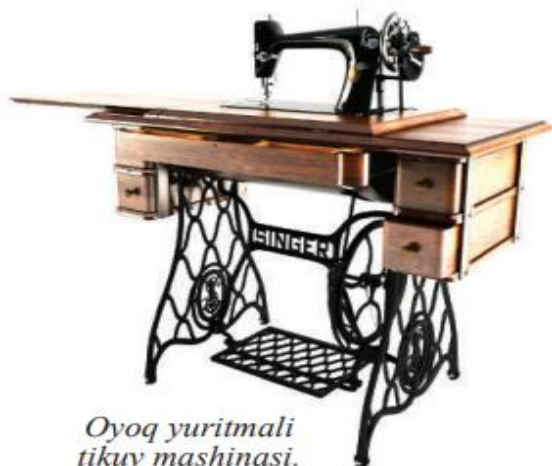
Oyoq yuritmalik tikuv mashinasi.