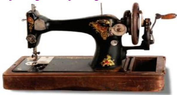
Qo‘l yuritmalik tikuv mashinasi.

sohiblari” deb qadrlashgan. Qo‘l mehnatiga ko‘p vaqt sarflansa-da, o‘zining nozikligi, nafisligi bilan ajralib turgan. Qo‘l choklarini bajarishga qaraganda tikuv mashinasida ishlash bir qancha qulay. Zamonaviy tikuv mashinalari bir qancha jarayonni bajarishga moslashgan bo‘lib, universal va maxsus tikuv mashinalariga bo‘linadi. Universal tikuv mashinalari baxyaqatorning barcha turini bajaradi, izma, tugma, kashta tikadi. Ulardan, asosan, uy sharoitida foydalaniladi. Uy sharoitida bir kishi biron-bir buyumni boshidan oxirigacha tikadi. Maxsus tikuv mashinalari esa ishlab chiqarish korxonalarida qo‘llangan bo‘lib, bitta jarayonni bir kishi bajaradi. Maxsus mashinalar o‘ziga xos kichik mexanizatsiya vositalari yordamida gazlama chetiga mag‘iz qo‘yish, shakldor choklarni bajarishga mo‘ljallangan.