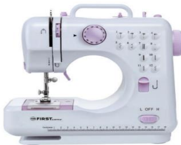
Elektr yuritmalik tikuv mashinasi.

Maxsus tikuv mashinasida yetarli tajribaga ega bo‘lgan, o‘z kasbining ustalari, tikuvchilar ishlaydi. Tikuv mashinalari turiga qarab qo‘l yuritmalik, oyoq yuritmalik hamda elektr yuritmalik bo‘ladi. Zamonaviy tikuv mashinalarida barcha jarayonlar avtomat dasturlashtirilgan bo‘lib, tikuv mashinasi “start/stop” tugmalari orqali boshqariladi. Tikuv mashinalari turlicha bo‘lsa-da, uning ishlash mexanizmlari bir xil. Tikuv mashinasida ishlashdan avval boshqaruv yo‘riqnomasi bilan tanishib chiqish kerak bo‘ladi.