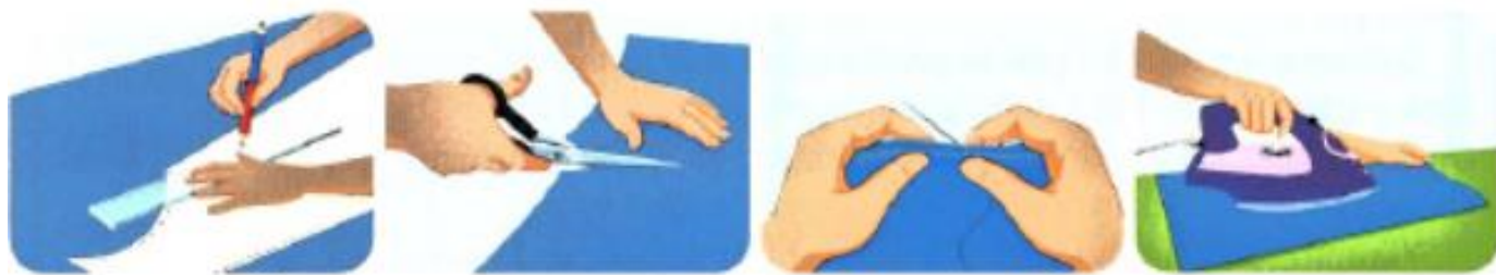
Qo'lda bajariladigan ishlar.

kiyim-kechak va uy-ro'zg'or buyumlarini qo'lda tikish, ta'mirlash va o'zgartirish mumkin. Hatto tikuv mashinasidan foydalanganda ham ko'p ishlarni qo'lda bajarish kerak.