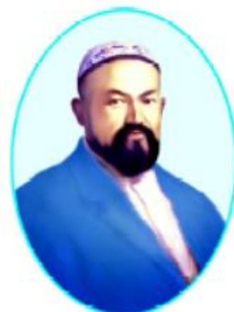
Munavvar qori Abdurashidxonov (1878—1931)