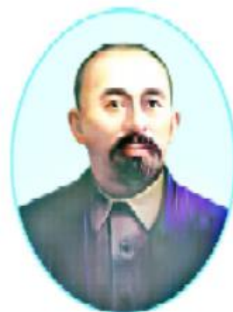
Abdulla Avloniy (1878—1934)