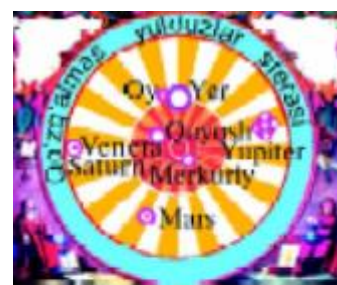
Quyosh – olam markazi