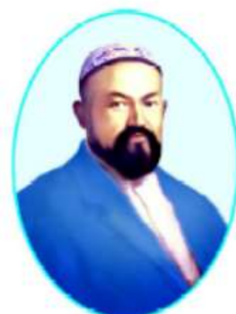
Munavvar qori Abdurashidxonov (1878—1931)