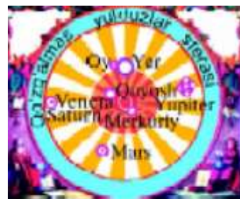
Quyosh – olam markazi