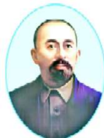
Abdulla Avloniy (1878—1934)