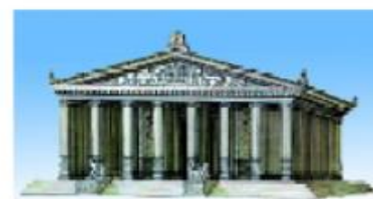
Ma'buda Artemida ibodatxonasi