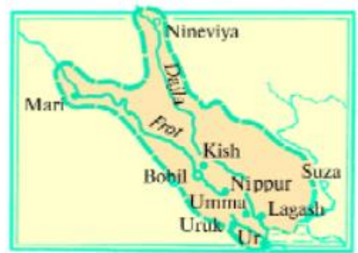
Ikki daryo oralig'idagi davlatlar

Qadimgi Misr va Babil davlatlari. Davlat – ma'lum bir hududda uyushgan odamlar (kishilik jamiyati)ni qonun kuchi bilan boshqaradigan tashkilot. Qonun esa davlat tomonidan belgilab qo'yiladigan va hammaning bo'ysunishi shart bo'lgan tartibqoidalardir. Davlat dastlab miloddan avvalgi to'rtinchi ming yillik boshlarida Misr hududida tashkil topdi. Ular kichik-kichik shahar -davlatlar edi. Keyinchalik bu davlatlar o'rnida ikkita katta davlat tashkil etildi. Davrlar o'tishi bilan bu ikki davlat yagona davlatga birlashtirildi. Memfis shahri davlat poytaxti etib belgilandi. Davlatning ichki hayoti o'zaro urush- larsiz kechmadi. Uzoq davom etgan bu urushlar Misrni zaiflashtirdi. Oqibatda, Misrni dastlab Eron davlati, keyinchalik makedoniyalik Aleksandr, undan keyin esa Rim davlati bosib oldi. Osiyoning Misrdan uncha uzoq bo'lmagan qismida Frot va Dajla daryolari mavjud. Shu ikki daryo oralig'i Mesopotamiya deb atalgan. Mesopotamiya yerlari nihoyatda unumdor bo'lganligi uchun odamlar bu joylarni o'z manzilgohlariga aylantirdilar. Mesopotamiyada Babil davlati tashkil topdi. Podsho Xammurapi hukmronligi davrida Babil eng qudratli davlatga aylandi.