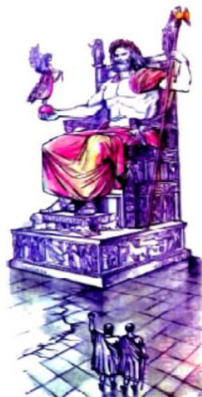
Olimp xudosi Zevs