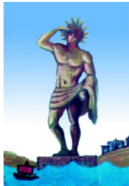
Quyosh xudosi Gelios haykali

VI. Uyga vazifani e‘lon qilish: yangi mavzuni to‘liq takrorlash va yangi mavzu yuzasidan bilimlarini mustaxkamlab kelish.