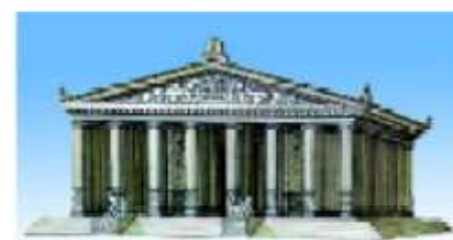
Ma'buda Artemida ibodatxonasi