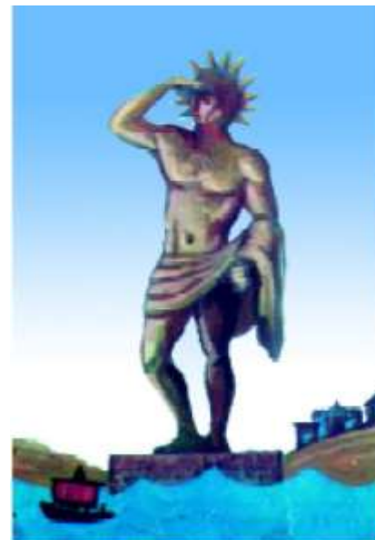
Quyosh xudosi Gelios haykali

– Quyosh xudosi Geliosning misdan balandligi 35 metrli haykalini bunyod etganlar. Haykaltarosh Xaros Quyosh xudosi Geliosning boshi Quyoshga tegib turgandek tasvirlagan haykalini bunyod etishga 12 yil sarfladi. Aleksandriya mayog‘i . Mil. avv. 283-yilda o‘sha zamonning ajoyib mo‘jizasi – Aleksandriya mayog‘i bunyod etildi. Mayoq kemalarning Aleksandriya shahri bandargohiga