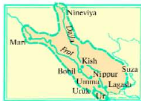
Ikki daryo oralig'idagi davlatlar

Qadimgi Misr va Babil davlatlari. Davlat – ma'lum bir hududda uyushgan odamlar (kishilik jamiyati)ni qonun kuchi bilan boshqaradigan tashkilot. Qonun esa davlat tomonidan belgilab qo'yiladigan va hammaning bo'ysunishi shart bo'lgan tartibqoidalardir. Davlat dastlab miloddan avvalgi to'rtinchi ming yillik boshlarida Misr hududida tashkil topdi. Ular kichik-kichik shahar -davlatlar edi. Keyinchalik bu davlatlar o'rnida ikkita katta davlat tashkil etildi. Davrlar o'tishi bilan bu ikki davlat yagona davlatga birlashtirildi. Memfis shahri davlat poytaxti etib belgilandi. Davlatning ichki hayoti o'zaro urush- larsiz kechmadi. Uzoq davom etgan bu urushlar Misrni zaiflashtirdi. Oqibatda, Misrni dastlab Eron davlati, keyinchalik makedoniyalik Aleksandr, undan keyin esa Rim davlati bosib oldi. Osiyoning Misrdan uncha uzoq bo'lmagan qismida Frot va Dajla daryolari mavjud. Shu ikki daryo oralig'i Mesopotamiya deb atalgan. Mesopotamiya yerlari nihoyatda unumdor bo'lganligi uchun odamlar bu joylarni o'z manzilgohlariga aylantirdilar. Mesopotamiyada Babil davlati tashkil topdi. Podsho Xammurapi hukmronligi davrida Babil eng qudratli davlatga aylandi.