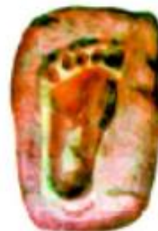
Toshga aylangan iz