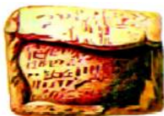
Xat yozilgan sopol

Moddiy manbalar. Moddiy manbalar – qadimgi odamlarning suyak qoldiqlari, ular yashagan makon, turar-joylarning, shuningdek, qalʼa va shaharlarning, uy-roʻzgʻor hamda zebziyat buyumlarining qoldiqlaridir. Shuningdek, qazish natijasida topilgan tangalar, gerblar, muhrlar hamda mehnat qurollaridir. Moddiy manbalarni arxeologlar toʻplashadi. Ular oʻtmishda odamlar yashagan deb taxmin qilingan manzilgohlarda qazish ishlarini olib boradilar. Shu yoʻl bilan moddiy manbalarni tashkil etuvchi turli ashyolarni topadilar. Ularning yaratilgan vaqtini va yoshini aniqlaydilar.