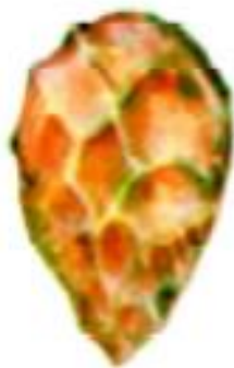
Toshdan yasalgan mehnat quroli

Tarixiy manba – bu, inson qoʻli bilan yaratilgan barcha narsalar va yozib qoldirilgan maʼlumotlar hamda kitoblardir. Manbashunos olimlar ularni sinchiklab oʻrganadilar va tarix fani uchun zarur maʼlumotlar toʻplaydilar. Tarixiy manbalar, oʻz navbatida, moddiy (ashyoviy) va yozma manbalarga boʻlinadi.