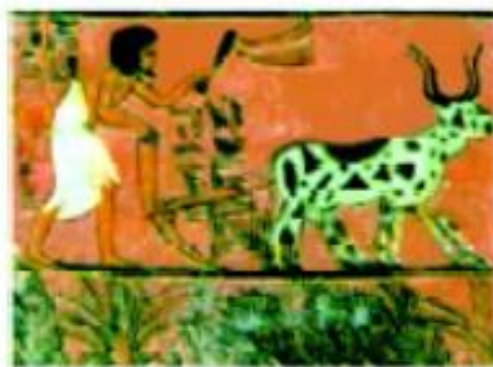
Devorga chizilgan rasm