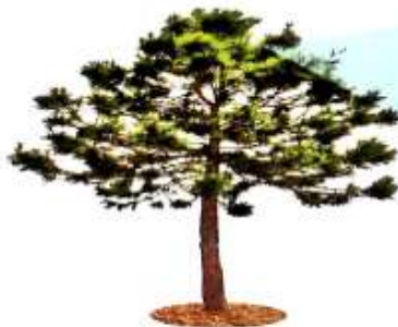
Qarag'ay – ignabargli o'simlik. Ignabargli o'simliklar urug'lari yordamida ko'payadi.