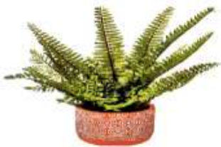
Qirqquloq – sporali o'simlik. Ular sporalari yordamida ko'payadi.