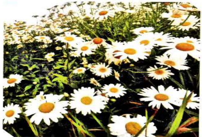
Atirgul va moychechak gulli o'simliklardir. Gulli o'simliklar urug'lari yordamida ko'payadi.