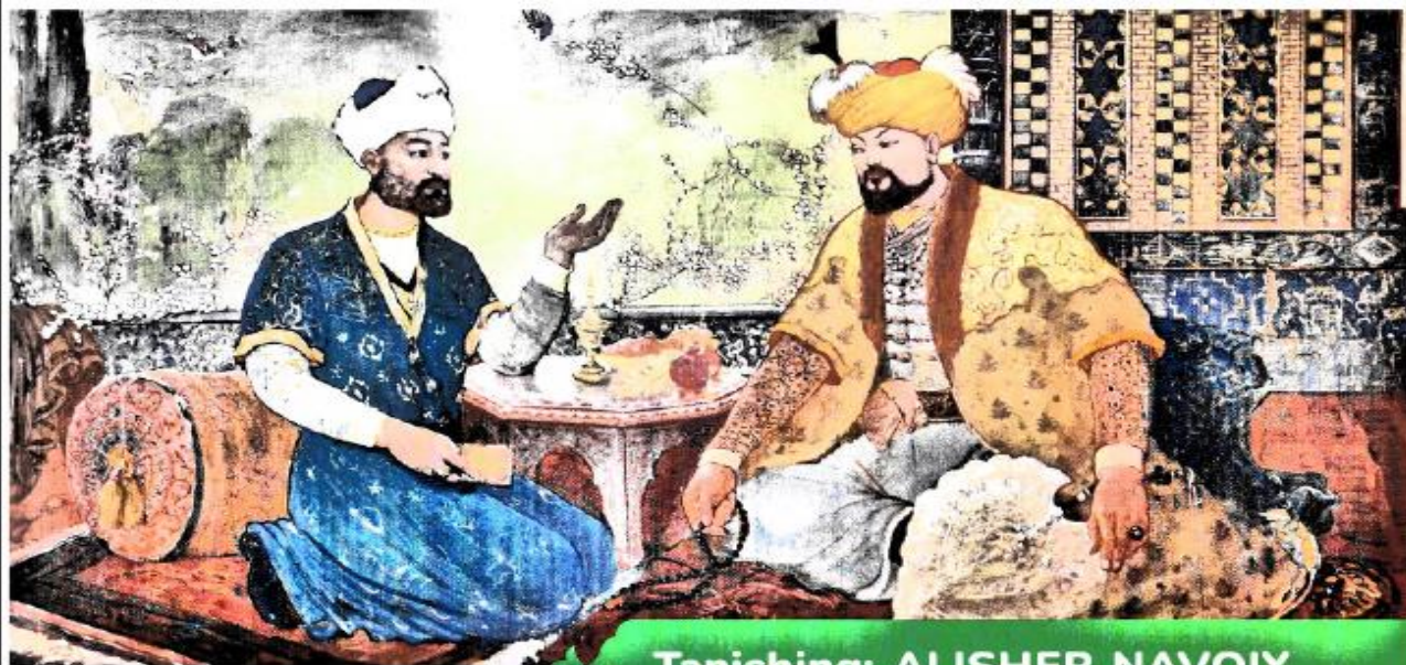
Alisher Navoiy va sulton Husayn Boyqaro.