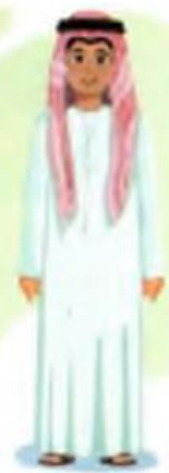
Birlashgan Arab Amirliklari

IV. Yangi mavzuni mustahkamlash: o'tilgan mavzu yuzasidan suhbat, savol-javob o'tkaziladi.