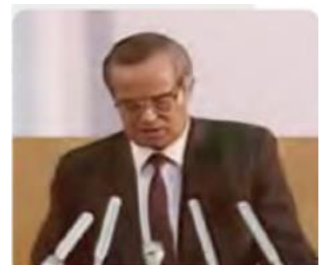
Islom Karimov davlat mustaqilligini e'lon qilmoqda