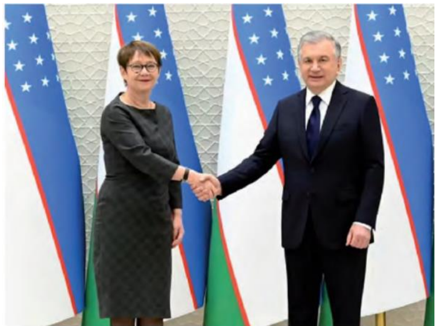
Yevropa tiklanish va taraqqiyot banki prezidenti Odil Reno-Basso va O'zbekiston Respublikasi Prezidenti Shavkat Mirziyoyev

Yl sog'liqni saqlash milliy tizimlarini qo'llab-quvvatlash orqali ham "COVID-19" pandemiyasini yengib o'tishga erishdi. 2022-yil fevralda Rossiya va Ukraina o'rtasida keng miqyosli urush boshlanishi bilan Yl Ukraina va uning xalqini qo'llab-quvvatlashni boshladi. Xususan, gumanitar va favqulodda yordam, moliyaviy va tezkor qo'llab-quvvatlash, shuningdek, harbiy yordam ko'rsatishni bugungi kunda ham davom ettirib kelmoqda. Yl Rossiyaning Ukrainaga qarshi urushini agressiya deb baholab, bu urushni xalqaro miqyosda qoralab kelmoqda va Rossiyaga qarshi keng miqyosli sanksiyalar e'lon qildi. Bu sanksiyalar Rossiyani iqtisodiy izolyatsiyalashga va agressiya uchun