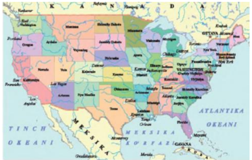
Amerika Qo'shma Shtatlari

Yuqori darajada rivojlangan sanoat mamlakati bo'lgan AQSH sayyoraning turli mintaqalarida o'zining hayotiy muhim manfaatlarini himoya qilish uchun nafaqat harbiy vositalarga ega edi, balki sanoat, savdo, moliyaviy, ilmiy-texnik, madaniy va boshqa vositalar ham uning jahon siyosatida nufuzi yuqori bo'lishida juda katta ahamiyat kasb etdi. AQSH hozir ham xalqaro maydonda shu vositalarning barchasidan unumli foydalanmoqda. B. Obama prezidentligining birinchi davrida dunyoda zo'ravonlikka, ekstremizm va terrorizmga qarshi kurash, AQSHning dunyodagi yetakchilik pozitsiyasini tiklash hukumat tashqi siyosatining ustuvoryo'nalishi deb e'lon qilindi. Unga dunyoni yadro qurolidan