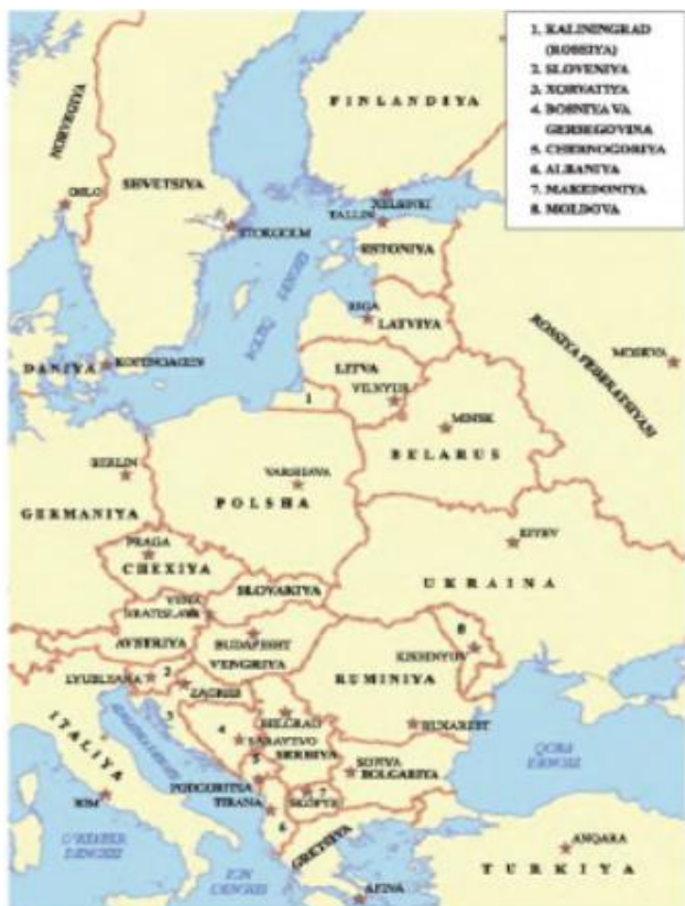
Sharqiy Yevropa mamlakatlari

1989-yil dekabrda Timishoara shahrida aholining tinch namoyishi Ruminiya maxfiy xizmati xodimlari tomonidan o'qqa tutilishi mamlakat bo'ylab qo'zg'olonning boshlanishiga olib keldi. Qo'zg'olon jarayonida mingdan ortiq kishi halok bo'ldi. Hokimiyat yangi tashkil qilingan Milliy qutqarish qo'mitasi qo'liga o'tdi. Qo'mita raisi bo'lgan Ion Iliesku 1990-yilgi saylovlarda mamlakat prezidenti etib saylandi. Germaniya Demokratik Respublikasida ham ijtimoiy-iqtisodiy va siyosiy inqiroz avj olib, 1989-yil noyabrda ikki nemis davlatini ajratib turgan Berlin devorining qulashiga olib keldi. 1990-yili Moskvada "Germaniya bilan munosabatlarni uzil-kesil tartibga solish to'g'risida"gi shartnoma imzolandi. Shartnomaga binoan, ikki nemis davlati (GDR va GFR) bitta — Germaniya Federativ Respublikasiga birlashdi. 1990-1992-yi I lari Sharqiy Yevropaning Chexoslovakiya, Bolgariya, Vengriya va Yugoslaviya kabi mamlakatlarida ham sotsialistik rejimlar bar-1989-yil 9-noyabrda Berlin devorining vayron bo'lishi ham topdi. Asosan, tinch yo'l bilan amalga oshirilgan demokratik inqiloblar natijasida Sharqiy Yevropa davlatlari rivojlanishning iqtisodiy va