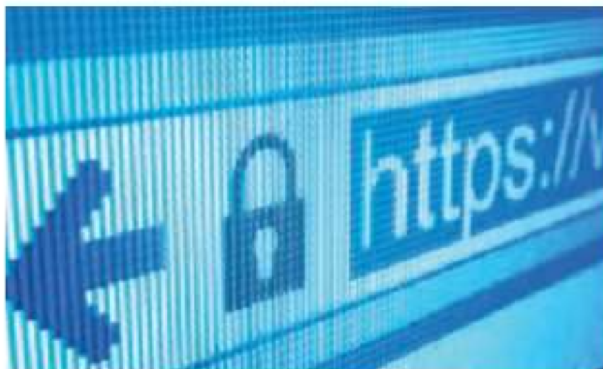
12.01-rasm. Elektron tijorat veb saytlaridagi xavfsizlik qulfining belgisi.

oshirish kabi ishlarni bajarishi uchun yetarli.