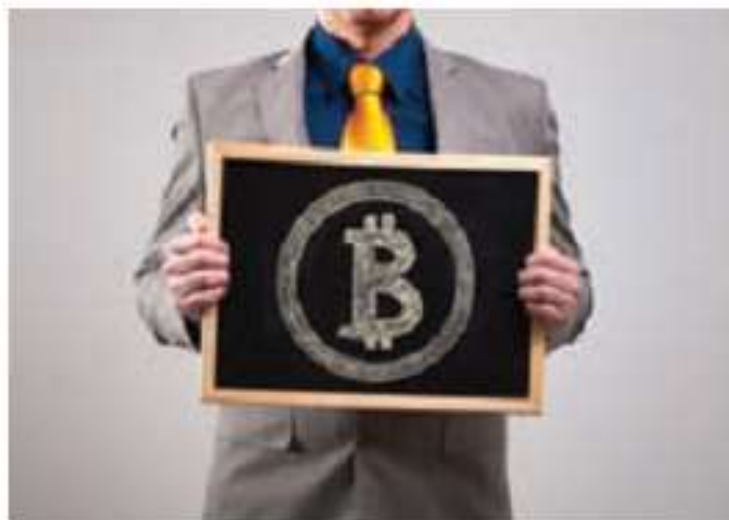
12.02-rasm. Bitcoin raqamli valyutasi belgisi.

IV. Yangi mavzuni mustahkamlash: o‘tilgan mavzu yuzasidan suhbat, savol-javob o‘tkazish orqali bilimlarini mustahkamlash.