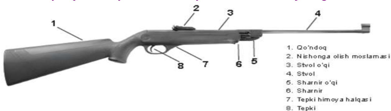
1-rasm. IJ-38 pnevmatik qurolining umumiy tuzilishi

IJ-38 pnevmatik quroli ommaviy ishlatiladigan sport pnevmatik qurollari tarkibiga kiradi. U 10 m masofada o'q otishda dastlabki o'rganuvchilar uchun qo'l keladi, shuningdek, bu qurol ommaviy o'q otish maydonchalarida foydalanish uchun mo'ljallangan.