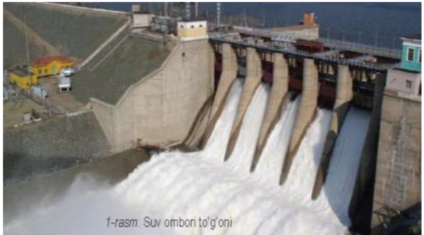
1-rasm. Suv ombori to‘g‘oni

evakuatsiya qilish xarajatlari, yerlarning hosildorlik qatlami yuvilib ketishi, suv bosgan hududlarda oziq-ovqat, kiyim-kechak, dori-darmon va boshqa kerakli mahsulotlarni olib kelish xarajatlari va boshqa salbiy talafotlarga olib keladi.