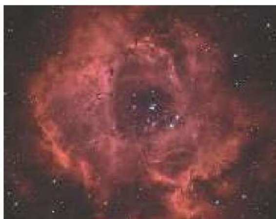
108-rasm. Yakkashox yulduz turkumidagi «Rozetka» gaz tumanligi.