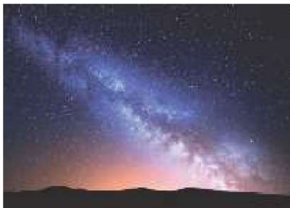
101-rasm. Galaktikamizning «belbog'i» hisoblanmish Somon Yo'li.

Bizning Quyosh ham (bir oddiy yulduz sifatida) shu ulkan yulduzlar sistemasining a'zosi bo'lgani uchun biz uni bizning galaktikamiz deb ataymiz (101-rasm). Galaktikamizga yon tomondan qaralsa, uning shakli qavariq linza ko'rinishiga o'xshaydi. Uning diametri salkam 100 ming yorug'lik yiliga, qalinligi esa 7 ming yorug'lik yiliga tengdir. Quyosh sistemasi galaktikamizning markazidan uning radiusining \frac{2}{3} qismiga teng (33 ming yorug'lik yili masofada) joylashadi (102-rasm). Agar galaktikamiz diskiga (ya'ni Somon Yo'li tekisligiga) tik yo'nalish tomondan turib qaralsa, markazidan spiral ko'rinishda tarqaluvchi va soat mayatnigining prujinasini eslatuvchi «yenglar»ni ko'ramiz (103-rasmga qarang). Quyosh sistemasi tomondan qaralganda, galaktikamizning markaziy yadrosi Qavs yulduz turkumiga proyeksiyalanadi.