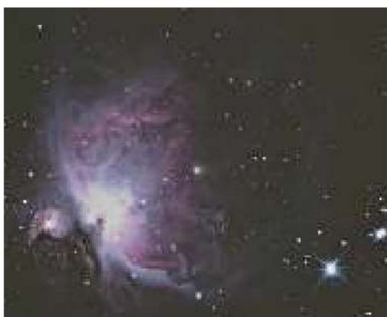
107-rasm. Orion yulduz turkumidan joy olgan ulkan Orion gaz tumanligi.

day chang muhitining borligiga Janubiy but yulduz turkumida proyeksiyala nadigan «Ko‘mir qopi» va Orion yulduz turkumida joylashgan «Ot boshi» tu manliklari yorqin misol bo‘la oladi (106-rasm). «Ko‘mir qopi» qora tumanligi bizdan 150 parsek masofada joylashgan, o‘lchami 8 parsekka yaqin Somon Yo‘lidagi tumanlik bo‘lib, uning burchak o‘lchami 3^\circ ni tashkil etadi. Tele skop bilan kuzatilganda uning ko‘rish chegarasida kuzatiladigan xira yulduzlarning soni, tumanlikdan tashqarida shunday maydonda kuza tiladigan yulduzlar sonidan taxminan 3 martacha kam chiqadi. Bunday yuti lish, yulduzlarning ko‘rinma kattaligini \Delta m = 1, 2 mkattalikka o‘zgarishiga (xiralashishiga) olib keladi. Galaktikada bunday tumanliklar ko‘p bo‘lib, xususan, Oqqush yulduz turkumidan boshlanib, Burgut, Ilon, Qavs va Aqrab yulduz turkumlarigacha cho‘zilgan chang tasmasi, Somon Yo‘lining bu qismida yul duzlarni bizdan «yashirib», unda ulkan qora ayrilikni vu judga keltirgan. Ayniqsa, galaktika marka ziga tomon yo‘nalishda (Qavs yulduz turkumi tomonida) qora tu manlik juda qu yuq bo‘lib, biz uchun qiziq sanalgan galaktikamizning markaziy qu yilma qismini o‘rganishga xalaqit qiladi.