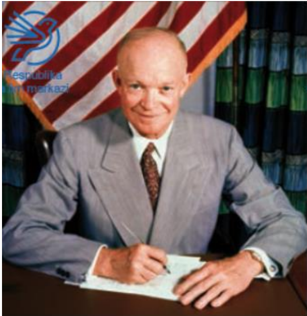
AQSH prezidenti Duayt Eyzenhauer

aylandi. 1952-yilgi saylovlarda respublikachilar partiyasi g'alaba qozondi. Ikkinchi jahon urushi qahramoni, urush yillari AQSHning Yevropadagi qo'shinlari qo'mondoni bo'lgan general Duayt Eyzenhauer AQSH prezidenti etib saylandi. Siyosatda realist bo'lgan D. Eyzenhauer iqtisodiyot va ijtimoiy sohada davlatning rolini oshirish lozimligini juda tez anglab yetdi. Shu sababli uning ma'muriyati ichki siyosatda, ayniqsa, ijtimoiy sohada o'zidan oldingi demokratlarning siyosatini biroz o'zgarishlar bilan davom ettirdi. 1960-yilgi prezidentlik saylovlarida demokratik partiya nomzodi Jon Kennedining g'alabasi urushdan keyingi Amerika tarixida muhim voqea bo'ldi. J. Kennedy o'zining "Yangi marralar" deb nom olgan islohotchilik dasturini ilgari surdi, iqtisodni barqarorlashtirish va ijtimoiy yordam dasturini kengaytirish bo'yicha juda ko'plab tadbirlar ishlab chiqdi va amalga oshirdi. J. Kennedy 1963-yil 22-noyabr da ikkinchi marta