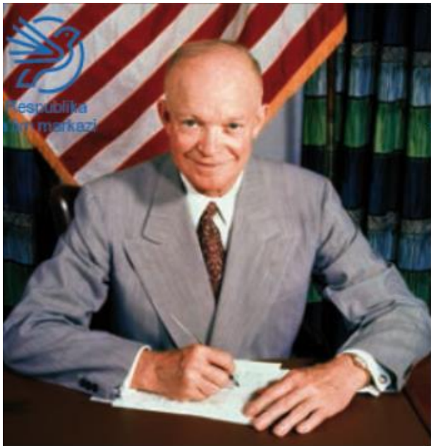
AQSH prezidenti Duayt Eyzenhauer

aylandi. 1952-yilgi saylovlarda respublikachilar partiyasi g'alaba qozondi. Ikkinchi jahon urushi qahramoni, urush yillari AQSHning Yevropadagi qo'shinlari qo'mondoni bo'lgan general Duayt Eyzenhauer AQSH prezidenti etib saylandi. Siyosatda realist bo'lgan D. Eyzenhauer iqtisodiyot va ijtimoiy sohada davlatning rolini oshirish lozimligini juda tez anglab yetdi. Shu sababli uning ma'muriyati ichki siyosatda, ayniqsa, ijtimoiy sohada o'zidan oldingi demokratlarning siyosatini biroz o'zgarishlar bilan davom ettirdi. 1960-yilgi prezidentlik saylovlarida demokratik partiya nomzodi Jon Kennedining g'alabasi urushdan keyingi Amerika tarixida muhim voqea bo'ldi. J. Kennedy o'zining "Yangi marralar" deb nom olgan islohotchilik dasturini ilgari surdi, iqtisodni barqarorlashtirish va ijtimoiy yordam dasturini kengaytirish bo'yicha juda ko'plab tadbirlar ishlab chiqdi va amalga oshirdi. J. Kennedy 1963-yil 22-noyabr da ikkinchi marta