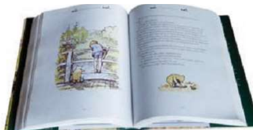
1.03-rasm. Statik ma'lumotlarga misol.