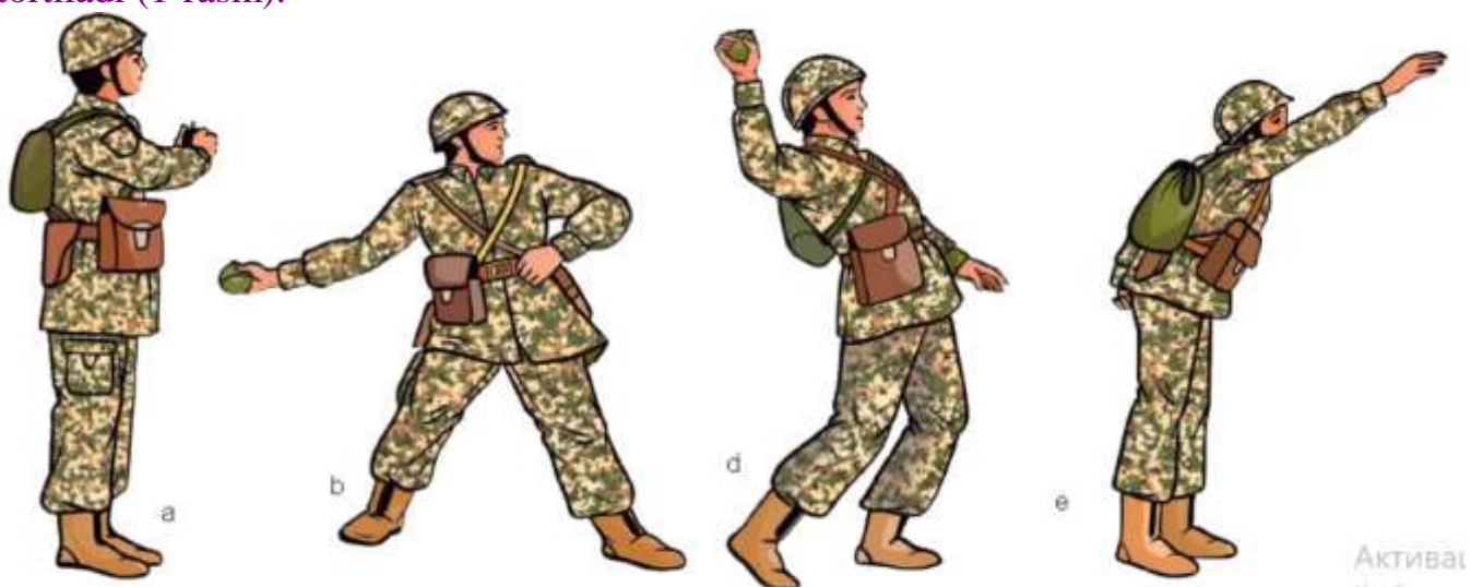
1-rasm. Granatani bir joyda tik turgan holatda uloqtirish usuli:

Uloqtirish mobaynida tana og'irligi chap (o'ng) oyoqqa o'tkazilib, qurol keskin ortga tortiladi (1-rasm).