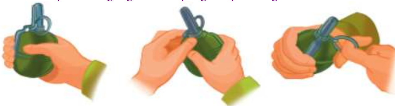
2-rasm. Zapalni burab o‘rnatish va saqlovchi tortqini sug‘urish