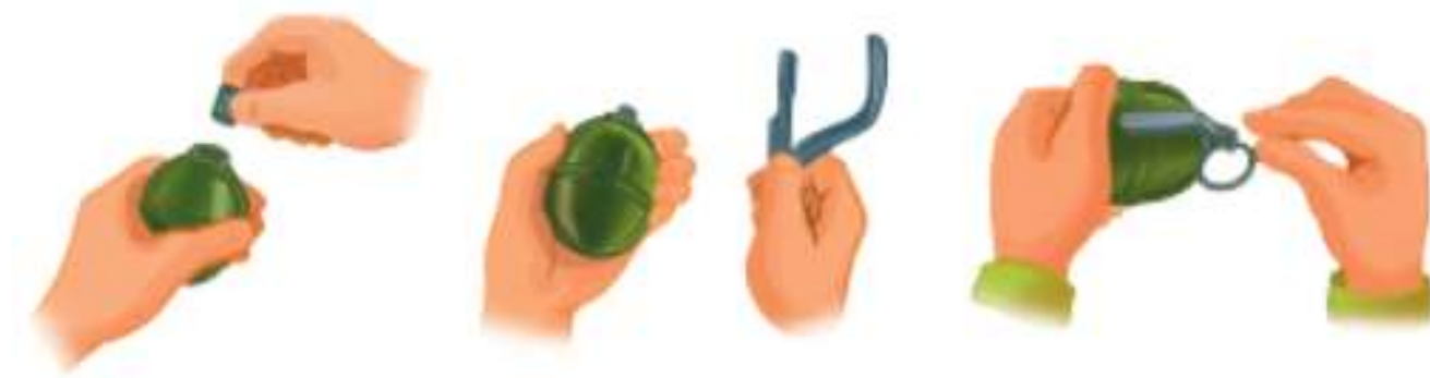
1-rasm. Granataga UZRGMni joylashtirish

Granatani uloqtirishdan oldin uloqtirishga hozirlik ko'rish (granatani jangovar holatga keltirish va uloqtirish holatini egallash) kerak, so'ng uni uloqtirish mumkin. Granatani o'qlash uchun uni avval sumkadan olish, korpus trubkasidan tiqinni chiqarish va zapalni trubkaga burab kiritish lozim (1-rasm).