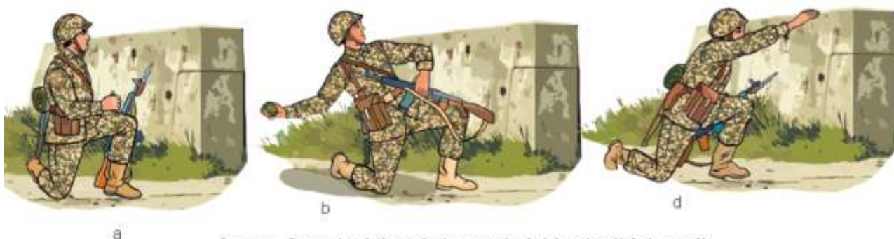
2-rasm. Granatani tizzada turgan holatda uloqtirish usuli:

biroz ko'tarilib, granatani yelka uzra oshirib, harakat so'ngida chap (o'ng) oyoq tomonga keskin bukilib, uloqtiriladi.