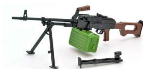
1-rasm. Kalashnikov pulemyoti (PKM)

PKM, SVD, RPG, PM qurollarining tuzilishi, vazifasi va jangovar Xususiyatlari 7,62 millimetrli Kalashnikov pulemyoti avtomat quroli hisoblanib, dushman qo‘shini va o‘t ochish vositalarini yakson qilishga mo‘ljallangan. SVD qurolining tuzilishi, vazifasi va jangovar xususiyatlari 7,62 millimetrli Dragunov merganlik miltig‘i mergan quroli hisoblanib, birdan paydo bo‘luvchi, harakatlanuvchi, ochiq va yashiringan yakka nishonlarni yo‘q