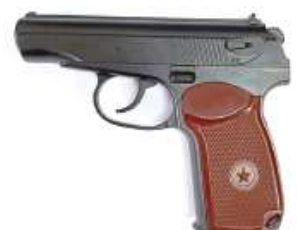
3-rasm. 9 millimetrlı Makarov to'pponchasi