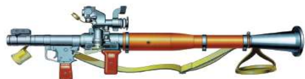
3-rasm. Tankka qarshi qo'l granatomyoti (RPG-7)ning umumiy tuzilishi

RPG-7 qurolining jangovar xususiyatlari Granatomyot tanklar, o'ziyurar artilleriya uskunalari va boshqa nishonlar 2 m va undan ortiq balandlikda va to'g'ri otish uzoqligida joylashgan holatda eng ta'sirli o't ochish masofasi: PG-7V granatasi bilan – 330 m; PG-7VM granatasi bilan – 310 m; mo'ljalga olish uzoqligi – 500 m; jangovar otish tezligi (1daq) – 4 – 6 granata. Granatomyotning optik mo'ljallagich bilan to'liq vazni: RPG-7