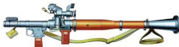
3-rasm. Tankka qarshi qo'l granatomyoti (RPG-7)ning umumiy tuzilishi

RPG-7 qurolining jangovar xususiyatlari Granatomyot tanklar, o'ziyurar artilleriya uskunalari va boshqa nishonlar 2 m va undan ortiq balandlikda va to'g'ri otish uzoqligida joylashgan holatda eng ta'sirli o't ochish masofasi: PG-7V granatasi bilan – 330 m; PG-7VM granatasi bilan – 310 m; mo'ljalga olish uzoqligi – 500 m; jangovar otish tezligi (1daq) – 4 – 6 granata. Granatomyotning optik mo'ljallagich bilan to'liq vazni: RPG-7