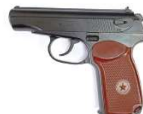
3-rasm. 9 millimetrlı Makarov to'pponchasi