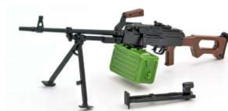
1-rasm. Kalashnikov pulemyoti (PKM)

PKM, SVD, RPG, PM qurollarining tuzilishi, vazifasi va jangovar Xususiyatlari 7,62 millimetrli Kalashnikov pulemyoti avtomat quroli hisoblanib, dushman qo‘shini va o‘t ochish vositalarini yakson qilishga mo‘ljallangan. SVD qurolining tuzilishi, vazifasi va jangovar xususiyatlari 7,62 millimetrli Dragunov merganlik miltig‘i mergan quroli hisoblanib, birdan paydo bo‘luvchi, harakatlanuvchi, ochiq va yashiringan yakka nishonlarni yo‘q