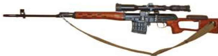
2-rasm. Dragunov merganlik miltig'i (SVD)