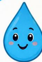
SUV – HAYOT!