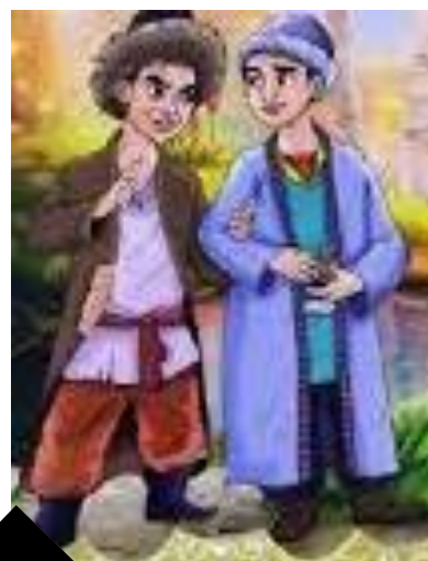
EGRI VA TO‘G‘RI