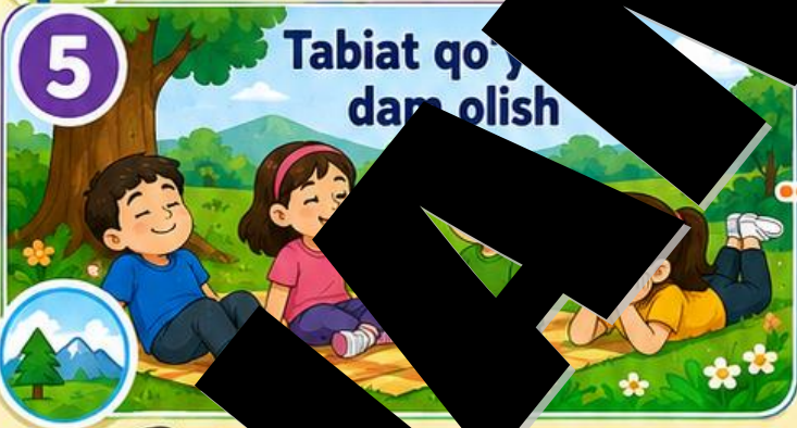
Tabiat qo'nyamida dam olish