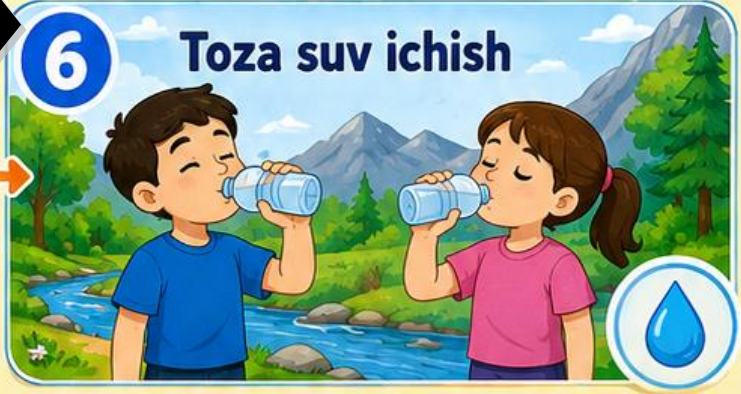
Toza suv ichish